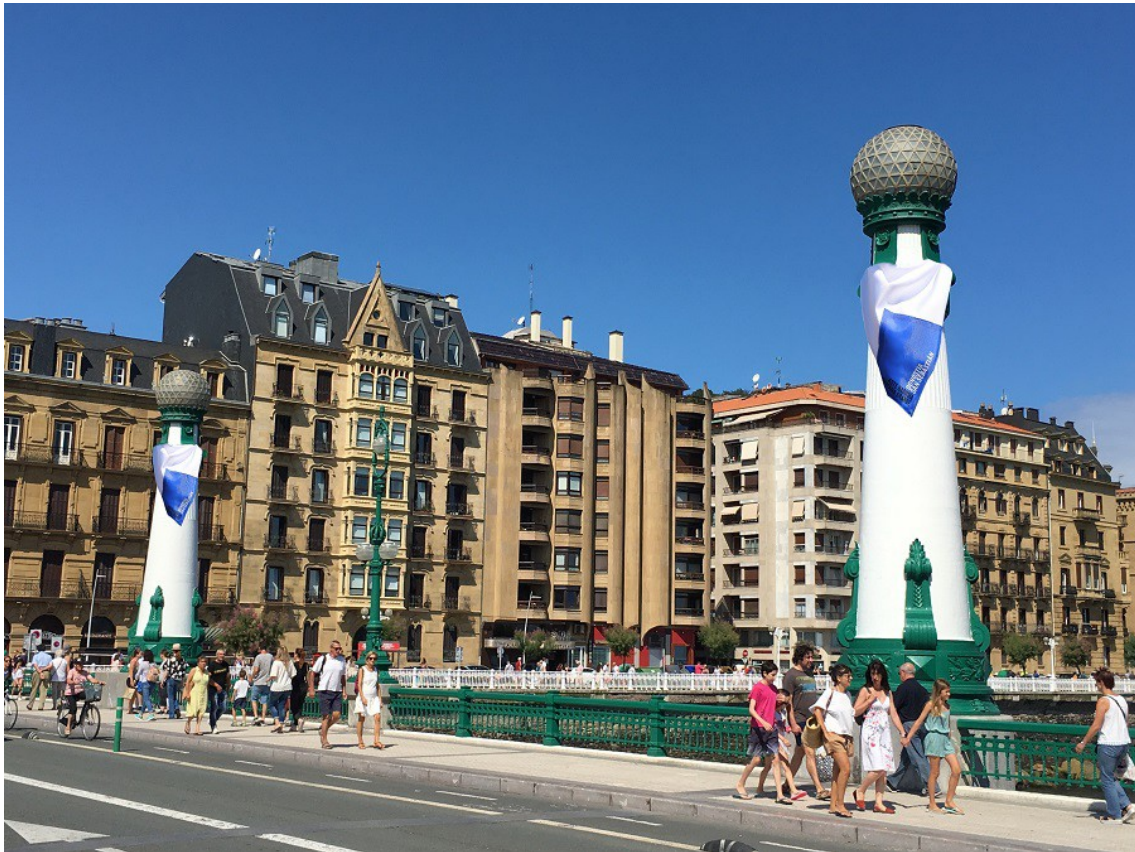
Fotomotuntatzean, farolak zapi eta guzti