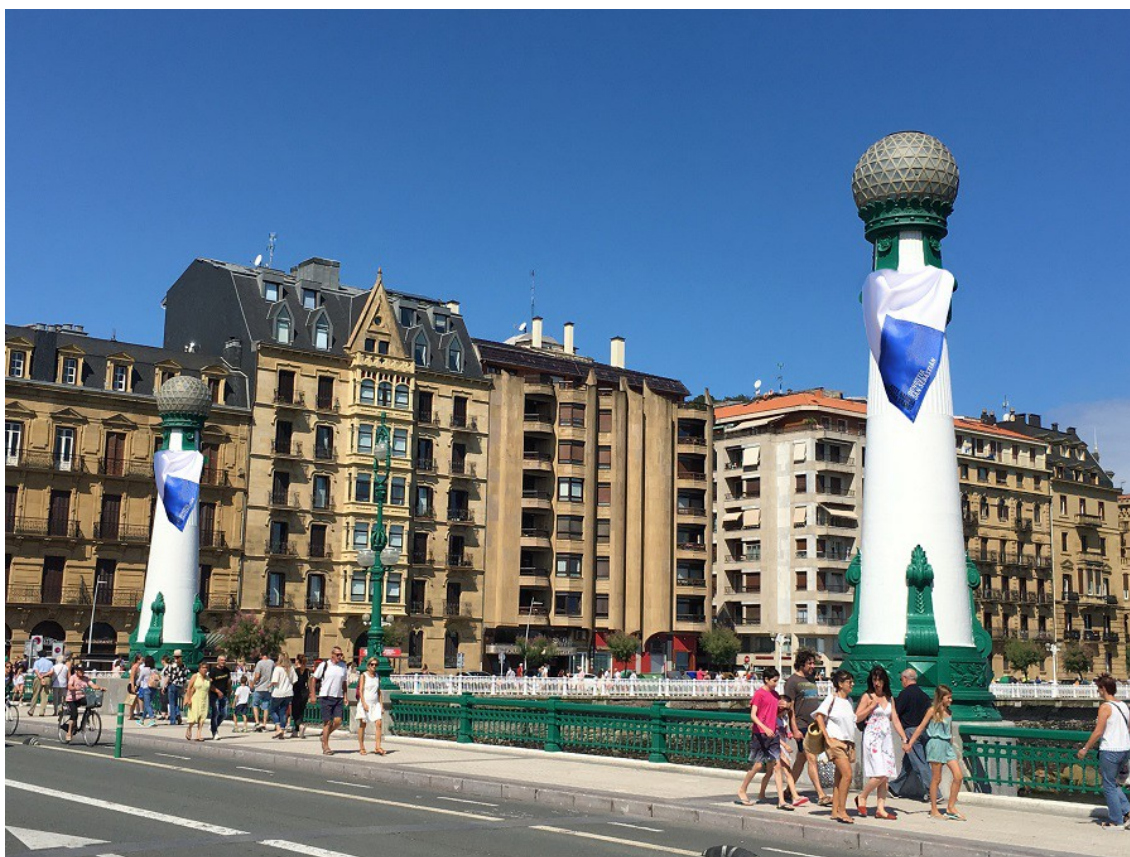
fotomontaje de las farolas con el pañuelo

Este año, además, el puente de Zurriola lucirá en cada una de sus seis farolas el pañuelo de la Semana Grande, “como si se tratara de gigantes que presiden la fiesta y que subrayan también el lema contra la violencia sexista”