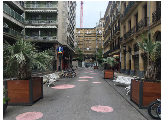
Blas de Lezo kalea

También el Teniente de Alcalde ha señalado que el Gobierno municipal aprobará la próxima semana los proyectos de peatonalización de las calles Blas de Lezo y Triunfo, en el Centro de la ciudad.