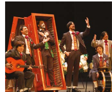
NO TE VAYAS TODAVÍA