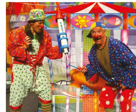
"TOMASEN ABENTURAK" FESTARA