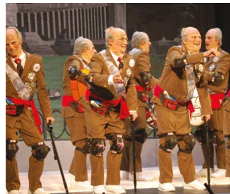
ESTA CHIRIGOTA CAE BIEN