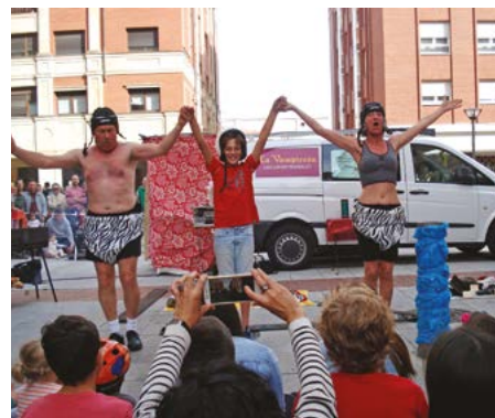
TRAPU ZAHARRA: ¡SE FINÍ!